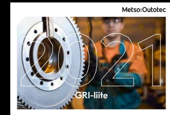
GRI-liite Ulkoisesti varmennetut vastuullisuustiedot GRI-standardien mukaisesti

Kaikki vuosikertomuksen osiot ovat saatavilla sekä suomeksi että englanniksi ja ne ovat ladattavissa vuosikertomussivustollamme osoitteessa www.mogroup.com/fi/vuosikertomus . Tässä vuosikertomuksessa sovelletaan integroidun raportin elementtejä.