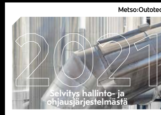
Selvitys hallinto- ja ohjausjärjestelmästä Hallinnointi, sisäinen valvonta ja riskienhallintajärjestelmät