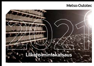
Liiketoimintakatsaus Strategia, arvonluonti ja vastuullisuus