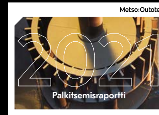
Palkitsemisraportti Hallituksen ja toimitusjohtajan palkitsemisraportti