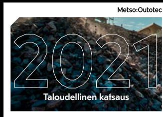
Taloudellinen katsaus Hallituksen toimintakertomus, tilinpäätös ja sijoittajatietoa